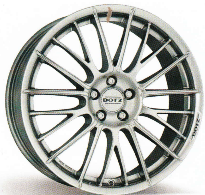
DOTZ Rapier shine 16", 17", 18"