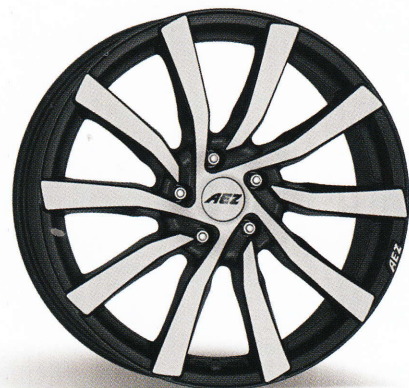
AEZ Reef/Reef SUV 17", 18", 19"/19", 20"