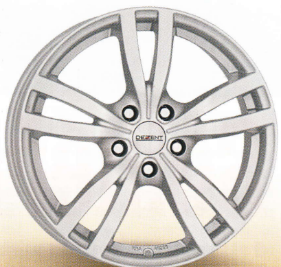
DEZENT TC 15", 16", 17"